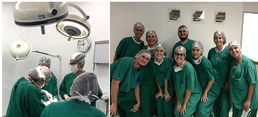
Figura 4 - Atendimento hospitalar realizado no Hospital Estadual de Bauru

Os atendimentos hospitalares são realizados por docentes auxiliados pelos estudantes como ilustra a FIGURA 4 .