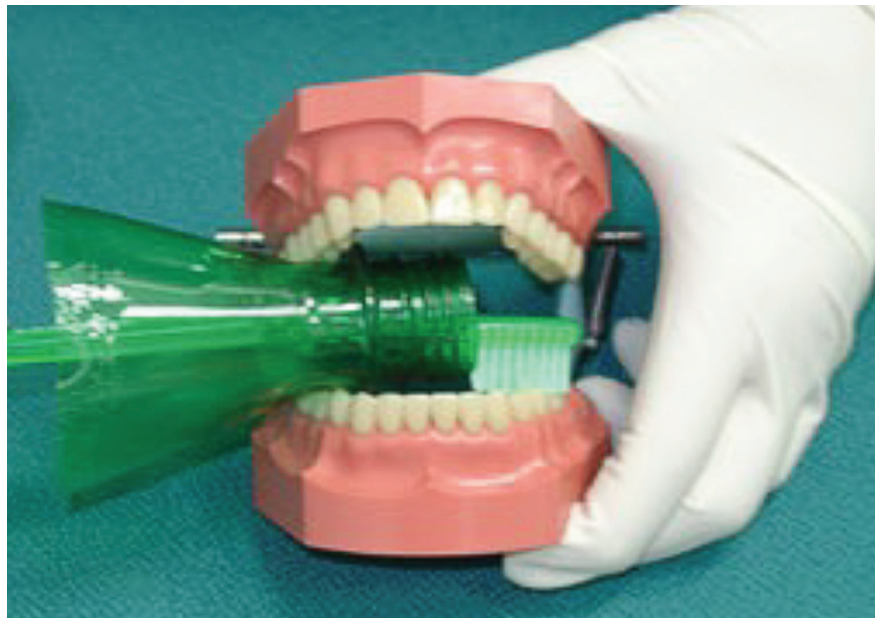
Figura 1 - Abridor de boca confeccionado a partir de garrafa PET

MARTA, Sara Nader et al. O paciente com deficiência e sua inclusão na Odontologia: Um relato de 24 anos de experiência. InterAção , Bauru, v. 01, n. 01, p. 95-108, 2021.