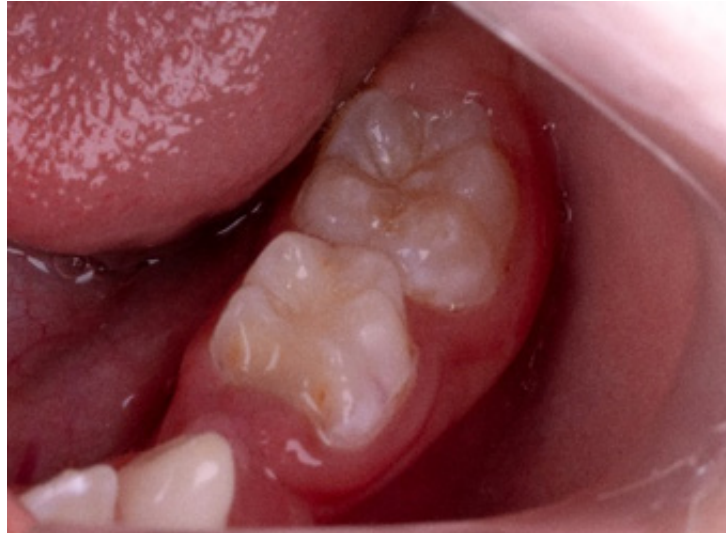
Figura 2: Coloração rosácea por vestibular no dente 75 e a ausência de fistula e edema.

evolução da reabsorção interna. Figura 2. Porém, radiograficamente, observou-se redução dimensional da reabsorção interna, principalmente na região de furca, onde foi visualizado aumento da densidade dentinária. Foi observada ainda presença de um remanescente radiolar distal do dente 74 e a ausência da radiolucidez (região cervical) do dente 73. Figura 3.