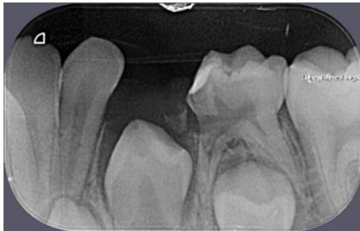
Figura 3: Imagem radiográfica após seis meses de acompanhamento. Diminuição na dimensão da RIR, com uma maior densidade de reparo dentário na região da furca (dente 75).

De acordo com os exames (clínico e radiográfico) e pelo relato do paciente referente a ausência de sintomatologia, considerou-se que o dente 75 apresentava-se vital, sem sinal de patologia periodontal. Assim, decidiu-se continuar o acompanhamento semestral, a fim de não submeter o paciente infantil a procedimentos complexos (como, a pulpectomia). Essa conduta clínica aplicada está de acordo com estudo prévio (PATEL et al., 2010).